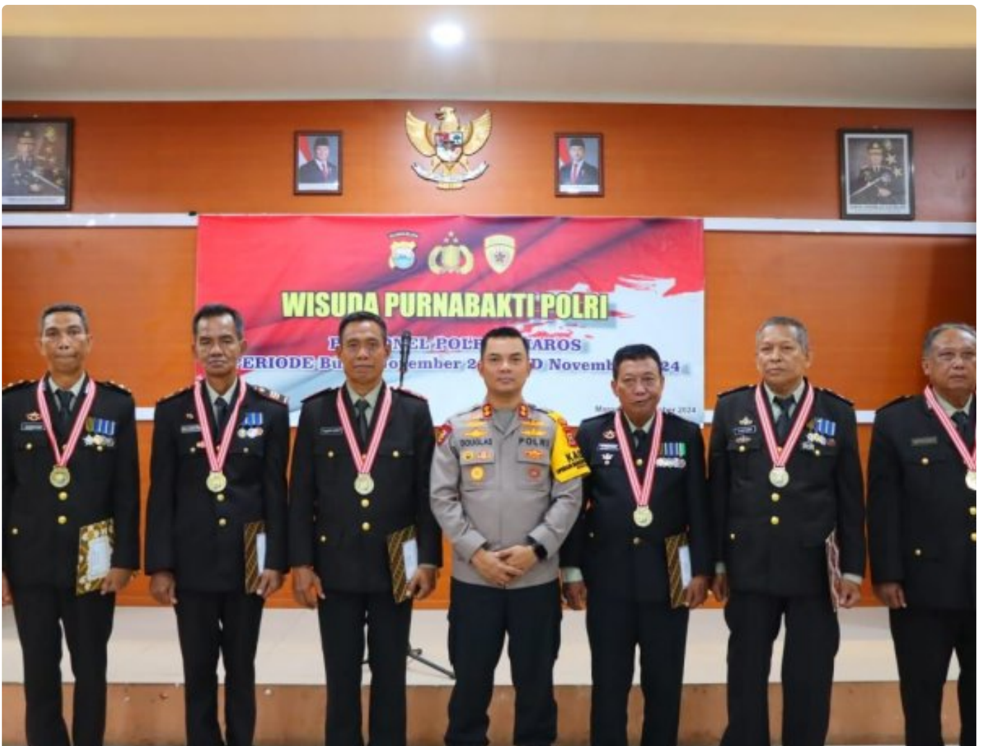
Bhayangkara - Humas Polres Maros

Maros - Polres Maros menggelar acara Wisuda Purna Bakti sebagai bentuk penghargaan terhadap pengabdian para anggota Polri yang telah memasuki masa pensiun.